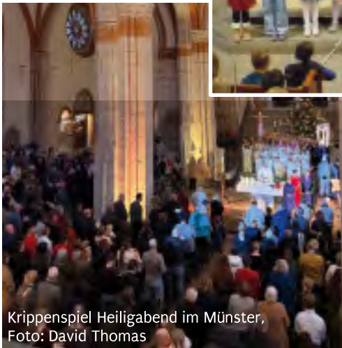
Krippenspiel Heiligabend im Münster, Foto: David Thomas