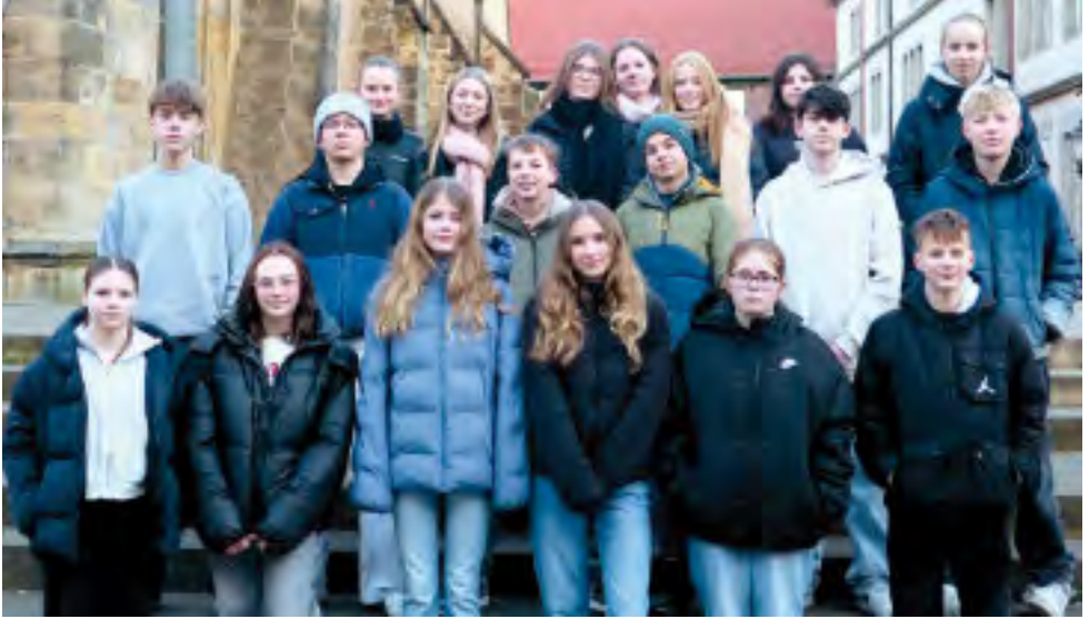
Konfirmation 18. Mai 2025, 10 Uhr im Münster