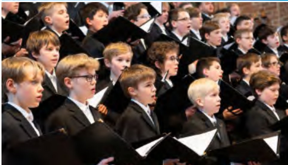
Knabenchor Hannover