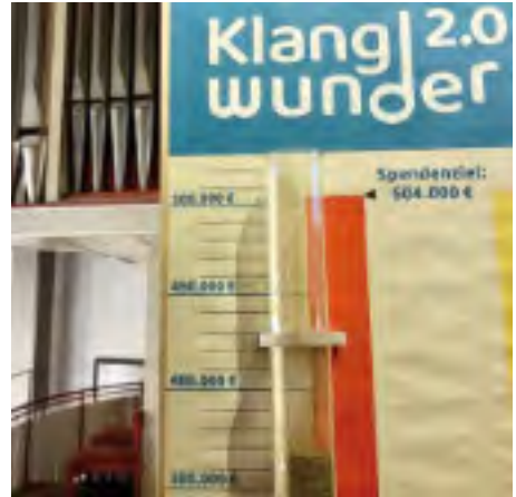
Spendenbarometer mit Orgel

Doch ein gutes Stück Weg liegt weiter vor uns: 135.000 € werden noch benötigt. Wir bitten Sie, lassen Sie nicht nach in Ihrem Bemühen um das Klangwunder! Werden Sie Teil der Klangwunder-Spendengemeinschaft, zeigen Sie ein Herz für unser Klangwunder und spenden Sie 25 Monate lang 50 €, verschenken Sie Orgelpatenschaften , wünschen Sie sich Spenden statt Geschenke!