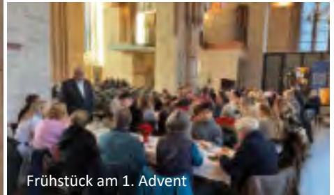
Frühstück am 1. Advent