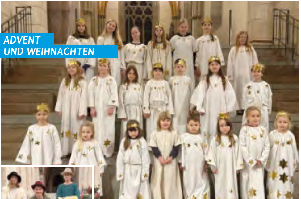
Engel beim Krippenspiel