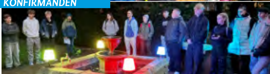
Konfis auf dem Friedhof