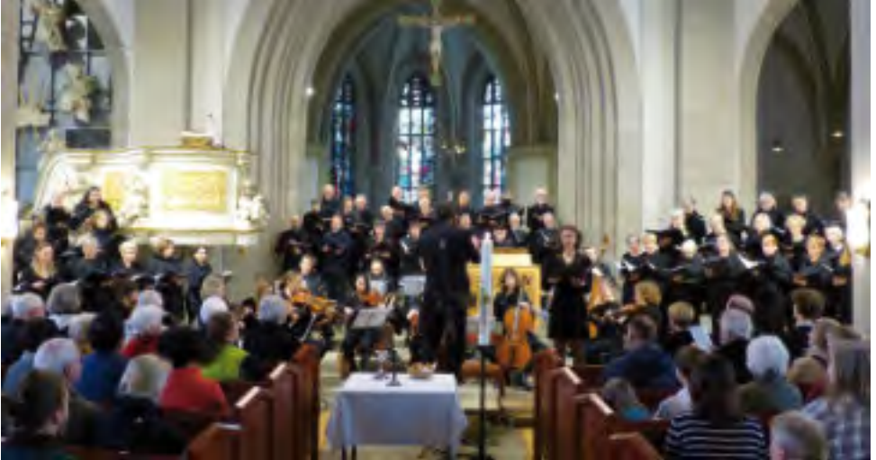
Kantatengottesdienst in der Marktkirche mit der Hamelner Kantorei