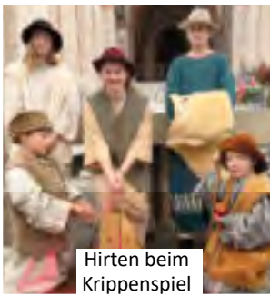
Hirten beim Krippenspiel